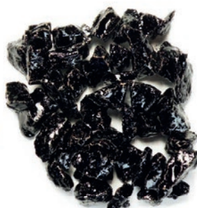
> 80 % Umhüllung