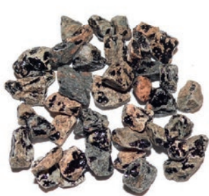
30 % Umhüllung

Bestimmt durch Flaschenrollverfahren EN 12697 – Teil 11