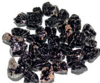
50 % Umhüllung